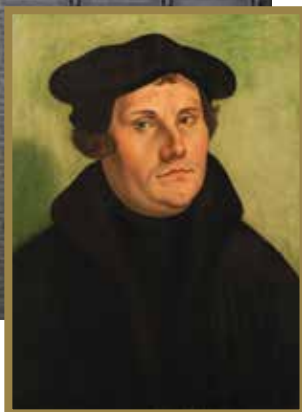
Martin Luther 1483-1546, malet af Lucas Cranach den Ældre