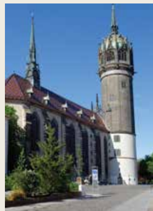
Slotskirken i Wittenberg

mig om at arbejde som jobkonsulent og mentor for unge, men nu er det tid til sangen igen og det ser jeg frem til. Glæder mig til at møde jer i jeres smukke kirke.