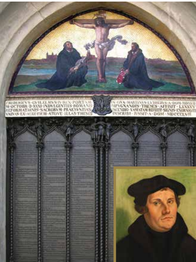
De 95 tesar indgraveret i bronze i Slotskirken i Wittenberg.