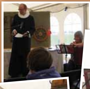
Sejler-gudstjeneste på Avernakø