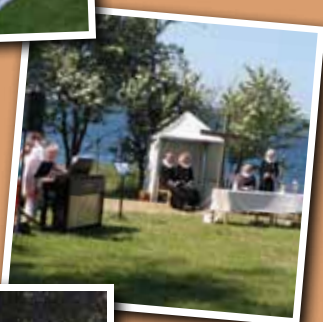
Friluftsgudstjeneste 2. pinsedag ved Klinten