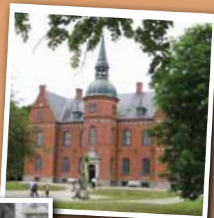
Sogneudflugt med Diernæs sogn gik i år til Skovsgård