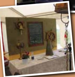
Alter ved sejler-gudstjeneste