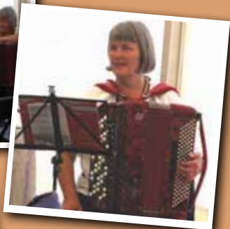
Harmonikaspil til sejler-gudstjeneste