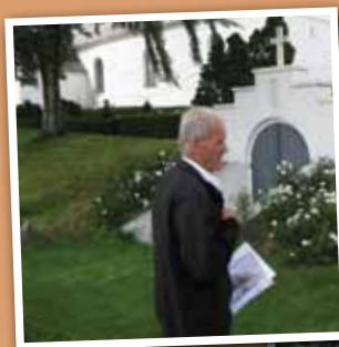
På kirkevandring i Diernæs